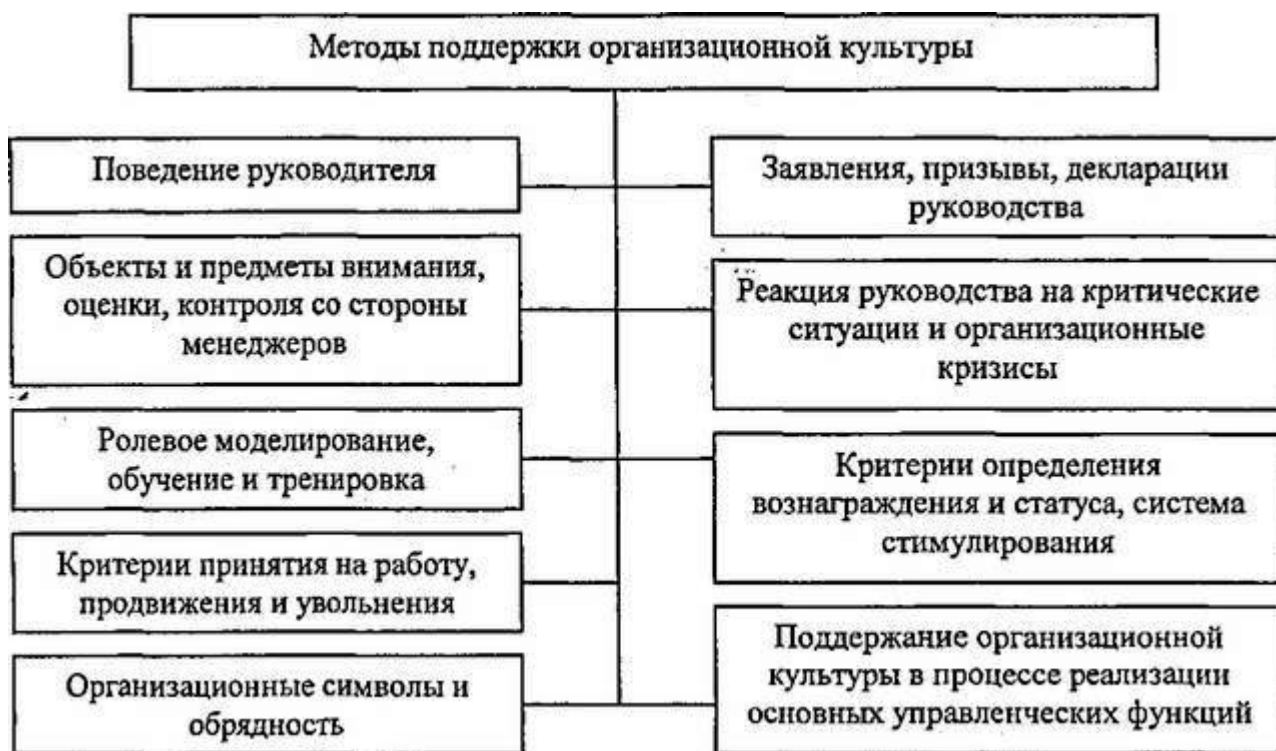
Рисунок 2 - Методы поддержки организационной культуры

Методы поддержки организационной культуры рассмотрены на рисунке 2.